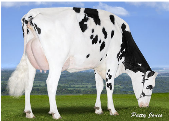
PEAK BOMBERO MAXIMA THIRD DAM